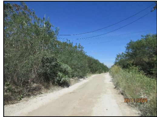
รูปที่ 2-1 การเว้นพื้นที่ไม่ทำเหมืองให้ห่างจากเส้นทางสาธารณะประโยชน์ทางด้านทิศตะวันตก