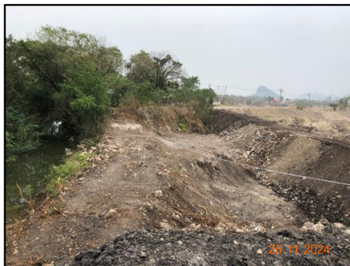
รูปที่ 2-9 ปอดักตะกอนภายในพื้นที่โครงการ