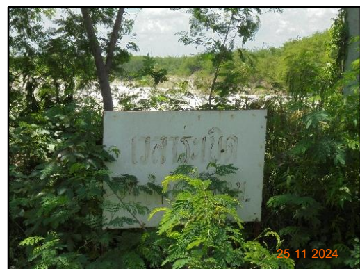
รูปที่ 2-3 การติดป้ายแสดงแนวเขตเว้นการทำเหมืองที่มองเห็นอย่างชัดเจน