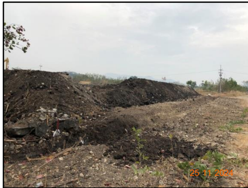
รูปที่ 2-8 ร่องระบายน้ำโดยรอบบ่อเหมือง