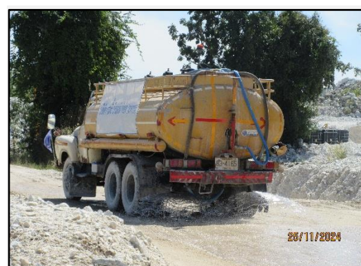
รูปที่ 2-10 การฉีดพรมน้ำบริเวณที่เกิดฝุ่นละออง ทั้งบริเวณหน้าเหมือง และเส้นทางขนส่งภายในพื้นที่ เพื่อลดการฟุ้งกระจายของฝุ่นละออง