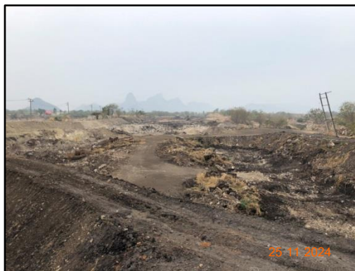
รูปที่ 2-7 คันทำนบดิน เพื่อใช้ในการเบี่ยงเบนทางน้ำร่วมกับร่องระบายน้ำ โดยรอบแนวเขตพื้นที่ประทานบัตร