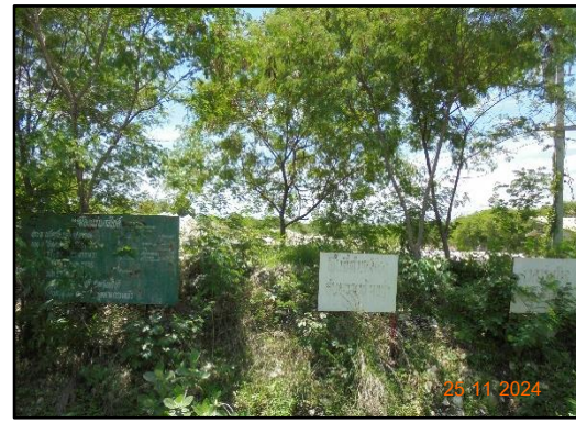
รูปที่ 2-15 ป้ายแสดงข้อมูลรายละเอียดเกี่ยวกับอายุประทานบัตรของโครงการ