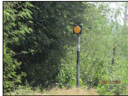
รูปที่ 17 สัญญาณไฟกระพริบ บริเวณริมเส้นทางขนส่งแร่