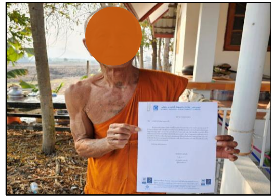
รูปที่ 2-13 การแจ้งผลการตรวจวัดและเฝ้าระวังปัญหาคุณภาพน้ำ