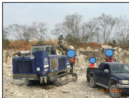
รูปที่ 2-12 พนักงานสวมใส่อุปกรณ์ป้องกันอันตรายส่วนบุคคลขณะปฏิบัติงาน