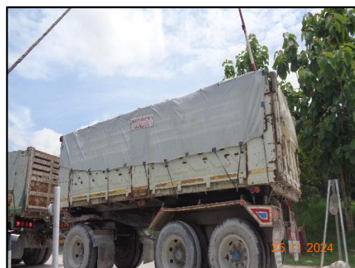
รูปที่ 2-11 รถบรรทุกขนส่งแร่ที่ปิดคลุมผ้าใบอย่างมิดชิด