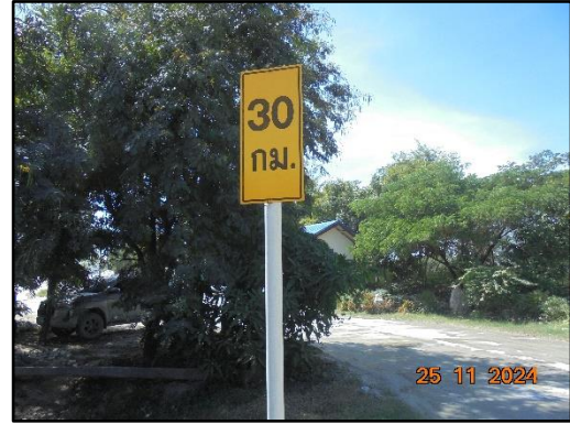
รูปที่ 18 ป้ายแจ้งเตือนความเร็วของรถขนส่งแร่ ระบุความเร็วไม่เกิน 30 กิโลเมตรต่อชั่วโมง