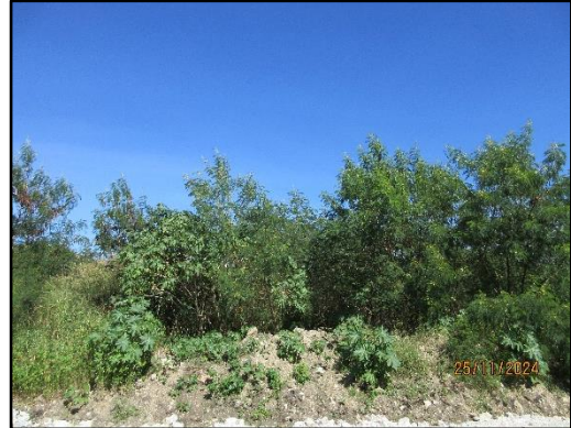
รูปที่ 2-14 สภาพต้นไม้ยืนต้นตามธรรมชาติโดยรอบพื้นที่โครงการ (ป่าเหมืองช้างเคียง)