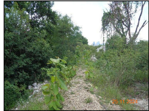
รูปที่ 2-4 การปลูกต้นไม้บริเวณพื้นที่เว้นการทำเหมือง