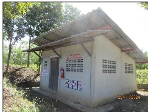
รูปที่ 2-6 ป้ายเตือนเขตการใช้วัตถุระเบิดที่สามารถมองเห็นได้อย่างชัดเจน