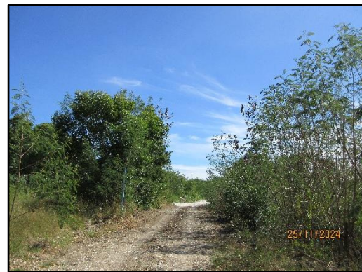
รูปที่ 2-16 ถนนภายในพื้นที่โครงการ