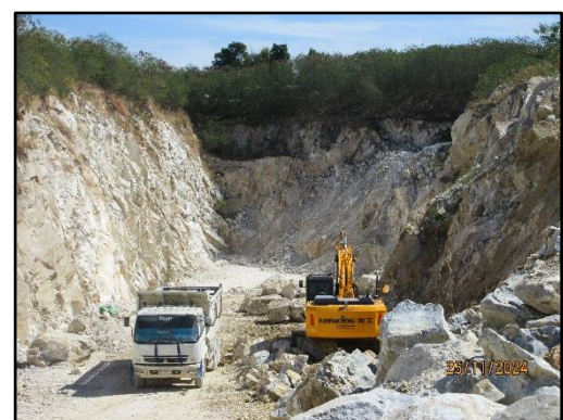
รูปที่ 2-5 สภาพหน้าเหมืองในปัจจุบันของโครงการ