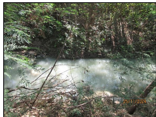
รูปที่ 2-2 ทางน้ำสาธารณะทางด้านทิศตะวันออก